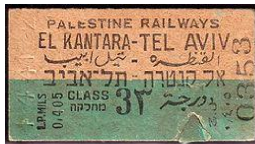
כרטיס רכבת מתקופת המנדט

לשלם לסבל גרוש למזוודה ב- 5.00 בבוקר מגיעים לאלכסנדריה לקחת טכסי ולבקש ביה"ס הגדול רחוב שקור פשה (להכנס ל)חדר השני ג'יין המבשלת ועבדו."